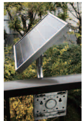
ソーラーパネル取り付け架台